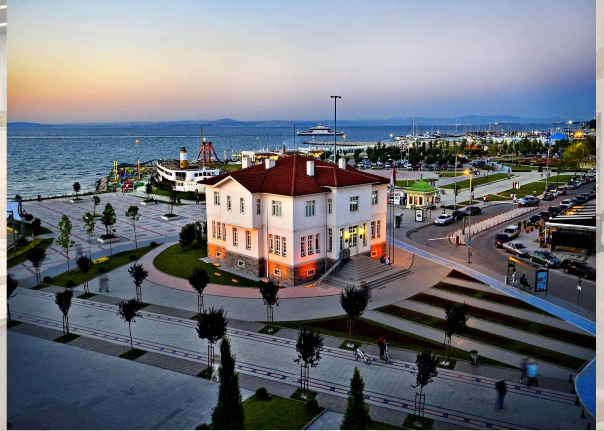
YALOVA ŞEHİR MÜZESİ