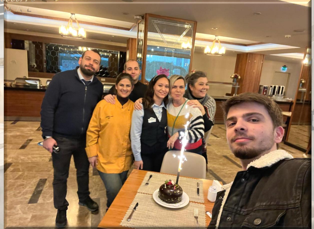
Doğum Günü ve Ayın Takım Çalışanı Kutlaması